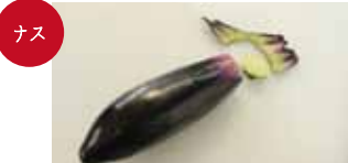
ナス ヘタのギリギリでカットし、残ったヘタは実からむいて剥がす。