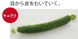
キュウリ ヘタのギリギリでカットする。